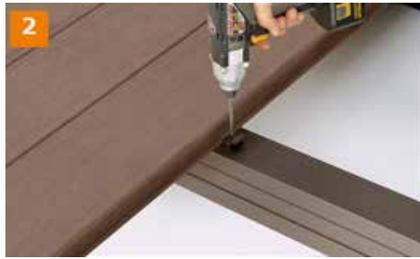
2 大引に横止め金具を固定します。