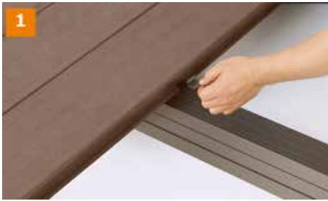
1 横止め金具を床板に当てるようにセットします。

横止め専用の金具で床板同士を連結する方法です。床板の隙間が均一に施工でき、また外観から金具やネジが見えないので、美しいデッキの仕上がりになります。