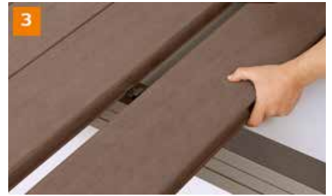
3 横止め金具に引っ掛けるようにして次の床板をはめ込みます。