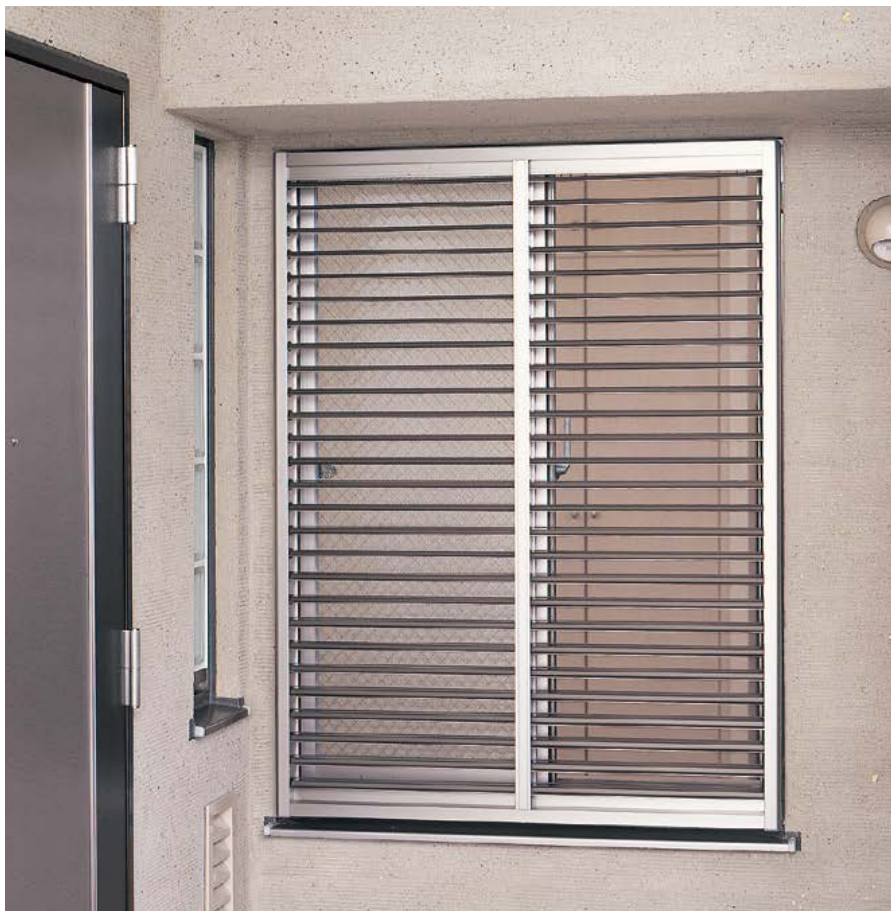
ルーバー全開時・方立付